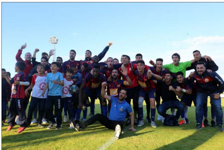
L'Escala celebraba el ascenso en el Municipal con el triunfo ante el Cassà