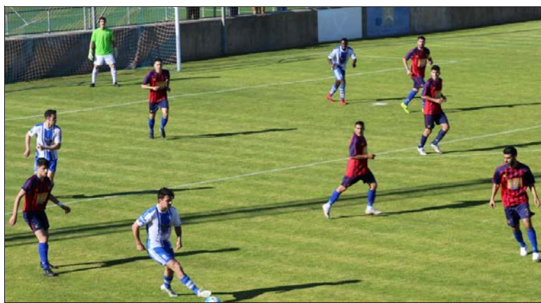
Los ampurdaneses sólo han cedido una derrota en casa este curso

Primera Catalana, un sueño que no se ha hecho realidad hasta este curso, en el tercer intento. Ni Albert Gasca ni Ricard Ferrer como entre-