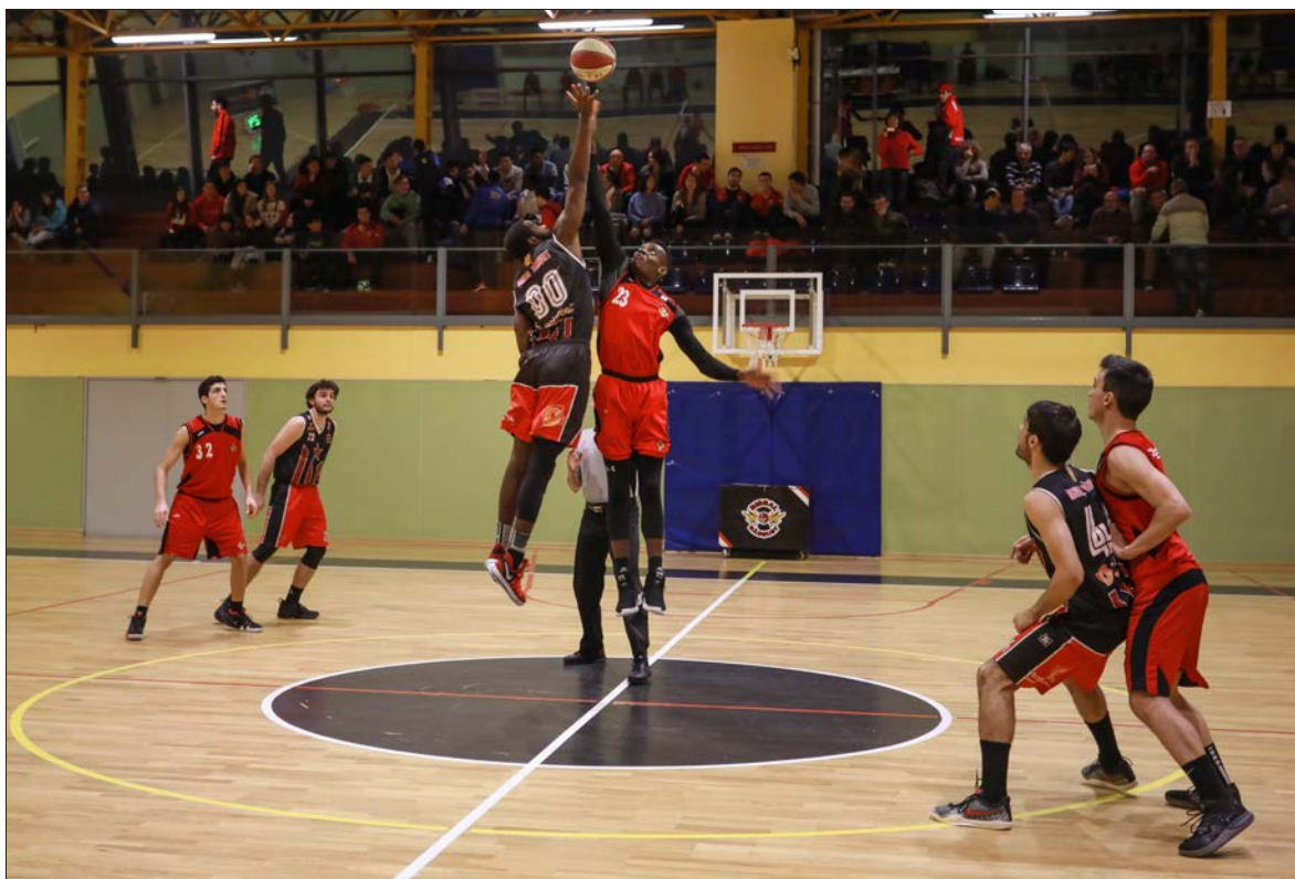
L'Artés va caure 87-69 a la pista del Sol Gironès Bisbal Bàsquet en el partit de la primera volta.