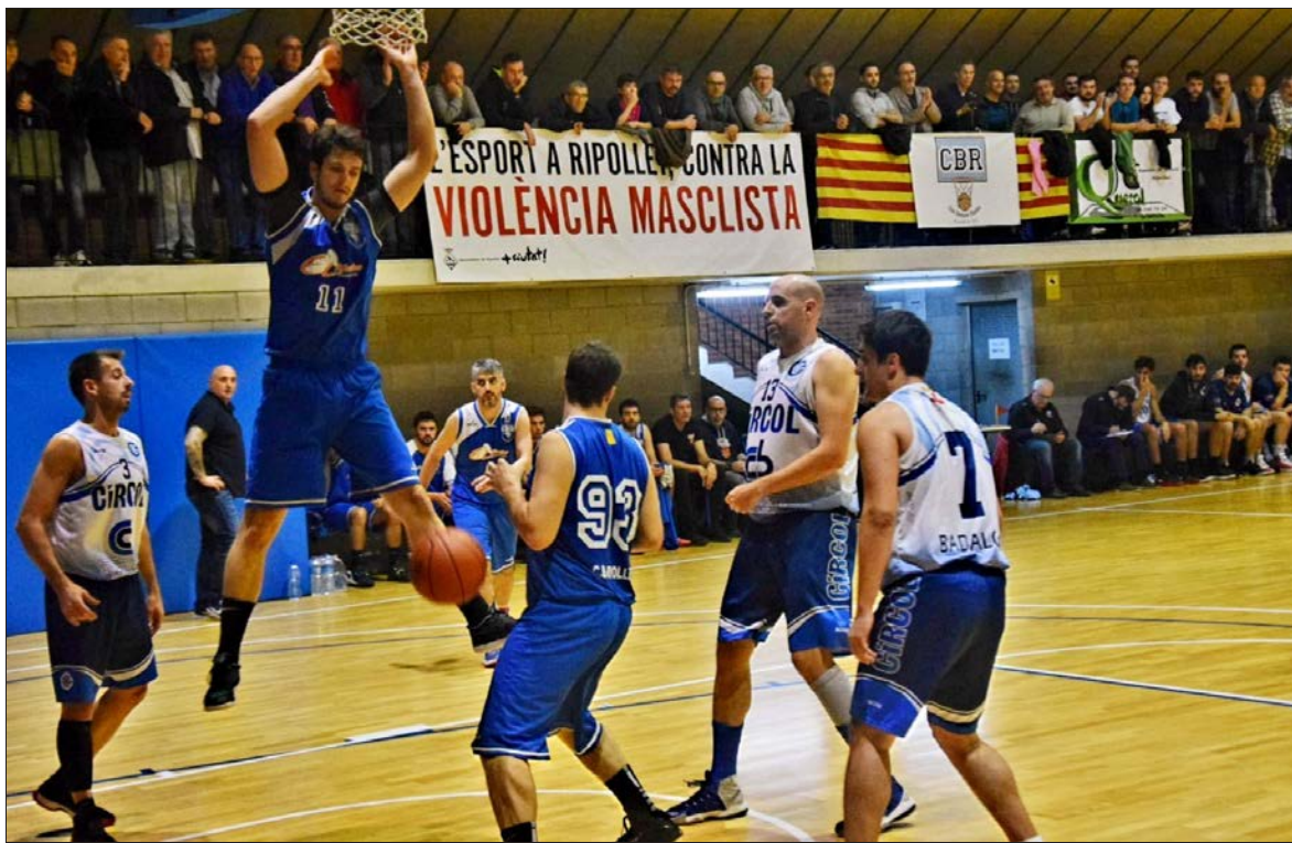
El Círcol Cotonifici està en un moment clau de la temporada