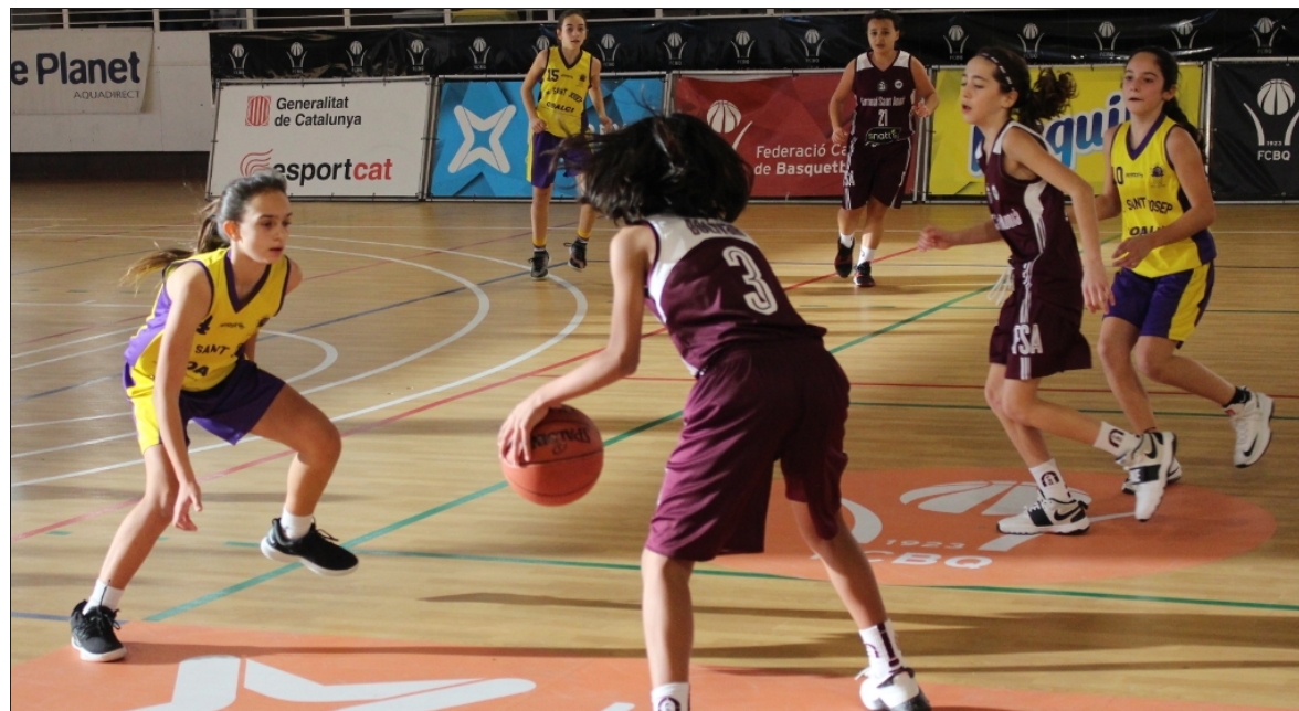
El Sant Adrià va guanyar el Trofeu Molinet en categoria femenina del 2018

La 56ª edició del Trofeu Molinet de minibàsquet, que enguany va començar el passat 27 de desembre, s'allarga fins avui. Nou dies de bàsquet de categoria formativa però amb un component competitiu rellevant. El tradicional torneig es disputa a dues seus de la capital catalana, el Pavelló de l'Illa Diagonal i en aquesta 56a edició, ha comptat també amb un nou escenari de joc, el Col·legi Major Sant Jordi de Barcelona. El Molinet és el torneig de minibàsquet consolidat en el panorama europeu amb especial participació d'equips d'arreu de Catalunya. Enguany, més de 700 nois i noies hi han participat en la vuitena de partits que s'hi juguen, i només resta conèixer quins equips inscriuran el seu nom en el palmarès de la competició en aquests nou dies de bàsquet, organitzats per la Federació Catalana de Basquetbol.